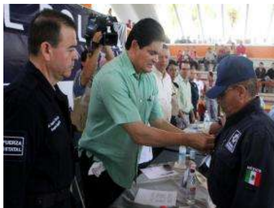
El mandatario estatal celebró el Día del Policía en el Instituto Estatal de Ciencias Penales y Seguridad Pública, ubicado en Aguaruto.

CULIACÁN._ En Sinaloa se ha perdido la paz porque la delincuencia está ganando las calles, reconoció el Gobernador Mario López Valdez, durante la celebración del Día del Policía.