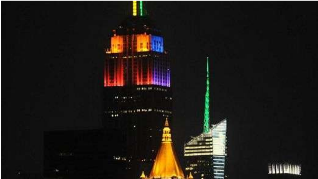
El Empire State, iluminado con los colores del arco iris, en honor a la semana del Orgullo Gay.