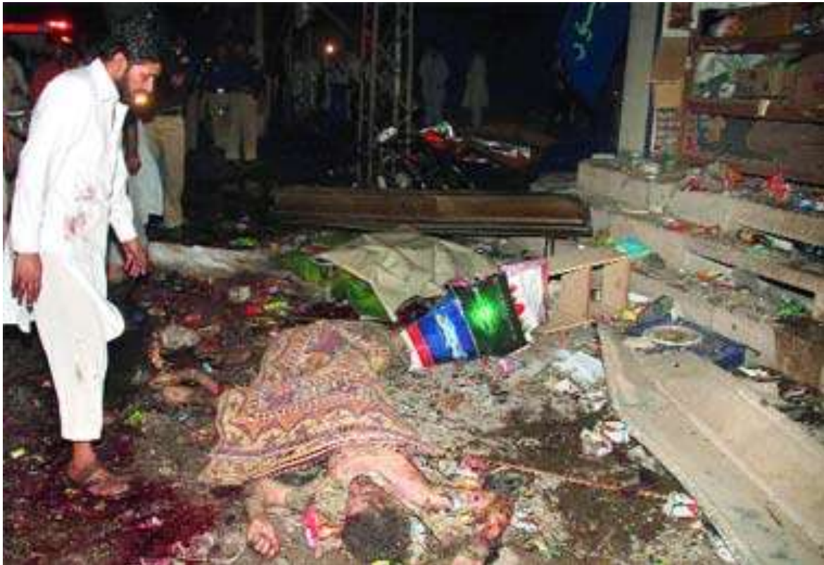
Mercado. Residentes y oficiales inspeccionan el lugar de las explosiones en Peshawar.

Indignación e ira entre políticos, organizaciones defensoras de los derechos humanos y sociedad paquistaní contra las fuerzas de seguridad del país fue lo que desató un video captado por un camarógrafo de una televisora local en el que se exhibe cómo un joven asaltante, al verse sorprendido cuando perpetraba un atraco, es detenido y, posteriormente, en un intento por recuperar su pistola, unos soldados le disparan hasta causarle la muerte, destacó la cadena CNN.