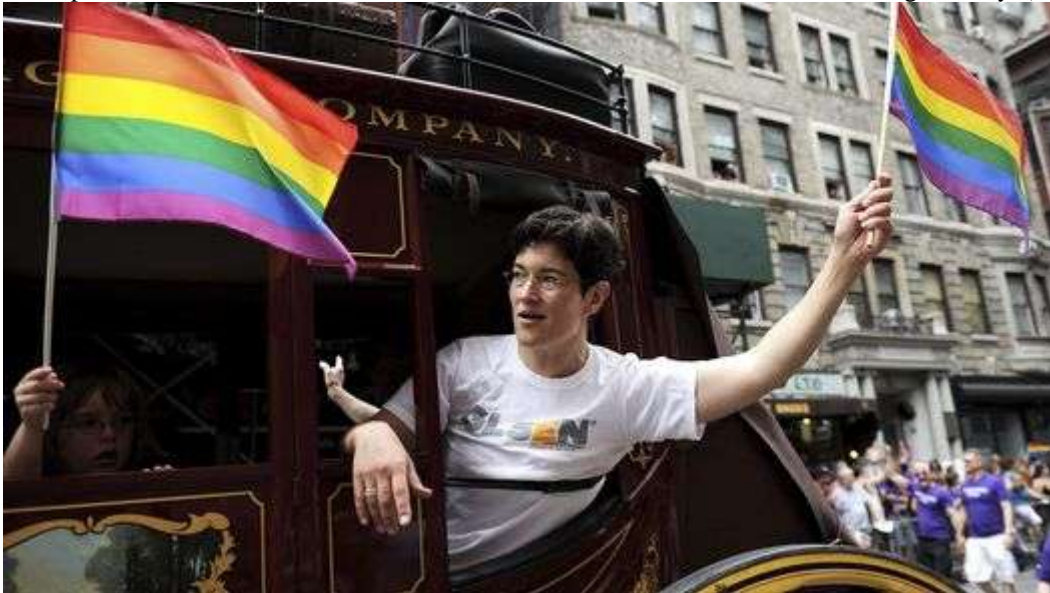
NY. Una mujer sostiene una bandera con el arcoíris durante el Desfile del Orgullo Gay.

Miles de personas participaron hoy de una eufórica y emotiva marcha del Orgullo Gay en Manhattan, que sirvió de escenario para celebrar la histórica ley de matrimonio homosexual aprobada en Nueva York hace apenas dos días.