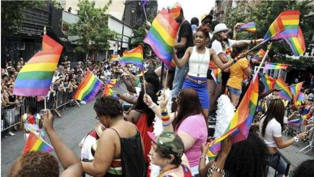
NY. La gente baila sobre una carroza durante el Desfile del Orgullo Gay.

El tradicional desfile de “orgullo gay” concentró este año a cientos de miles de personas para celebrar la decisión del estado de legalizar las bodas entre homosexuales.