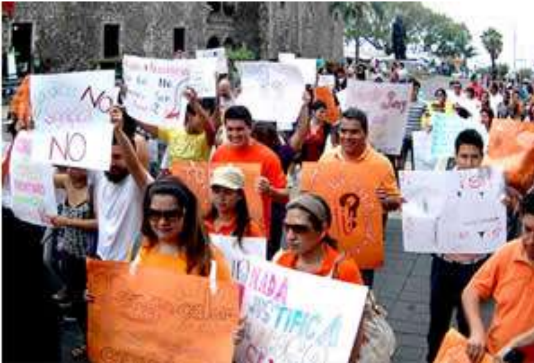
Morelia, Michoacán | Domingo 26 de junio de 2011

Esta fue una réplica de la Marcha de las putas que se llevó acbo en la ciudad de México, donde buscaron enfatizar que cuando ellas dicen no, es no